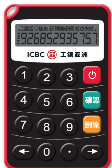
工銀亞洲電子密碼器